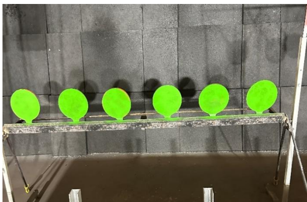
Konkurencja nr 1