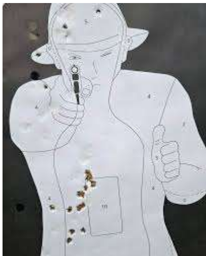
Konkurencja nr 1