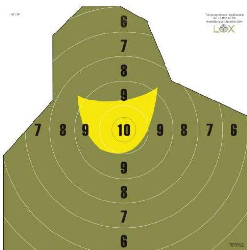
Konkurencja nr 3